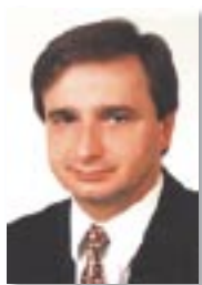
Waldemar Socha, prezydent Żor

W listopadzie tego roku Rada Miasta przyjęła zaktualizowany Wieloletni Program Inwestycyjny na lata 2005-2009. W sumie w programie przewidziano realizację ponad 40 zadań. Ich wykonanie przyczyni się do poprawy warunków życia mieszkańców, a także zwiększy atrakcyjność inwestycyjną Jastrzębia Zdroju. Wśród zadań, które będą miały wpływ na funkcjonowanie Strefy Ekonomicznej należy wymienić przede wszystkim te usprawniające układ komunikacyjny miasta. W sierpniu tego roku akceptację władz województwa śląskiego uzyskały złożone przez miasto w ramach Zintegrowanego Programu Operacyjnego Rozwoju Regionalnego dwa wnioski dotyczące modernizacji ulicy Libowiec jako drogi dojazdowej do terenów inwestycyjnych oraz modernizacji Alei Piłsudskiego (etap III). Łączna kwota dofinansowania inwestycji to 11 mln zł. Dzięki tym zadaniom tereny Strefy zostaną jeszcze lepiej włączone w sieć komunikacyjną miasta, ulegnie także poprawie płynność ruchu na głównej arterii Jastrzębia Zdroju.