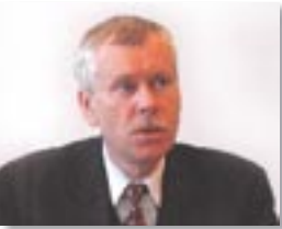
Tadeusz Wrona, prezydent Częstochowy

Dzięki tej inwestycji pracę znajdzie blisko 200 osób. Mam nadzieję, że będą to mieszkańcy Dąbrowy Górniczej. Nadal prawie 70 proc. dąbrowskich terenów KSSE czeka na zainteresowanych przedsiębiorców. Do 2016 roku na tym obszarze obowiązywać będą ulgi podatkowe i preferencje, proporcjonalne do wartości inwestycji i liczby stworzonych miejsc pracy. Sądzę, że jeszcze przez wiele lat Dąbrowa Górnicza będzie dobrym miejscem do inwestowania. W zasadzie każdy z inwestorów znajdzie u nas coś dla siebie. Oferujemy im działki o różnicowanych powierzchniach, od 1,4 ha do 258 hektarów. W końcówce roku paru inwestorów okazało zainteresowanie inwestowaniem w Dąbrowie Górniczej. Mam nadzieję, że porozumienia w tej mierze sfinalizują się z początkiem 2005 roku, czego sobie i inwestorom życzę!