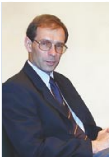
Zygmunt Frankiewicz Prezydent Gliwic

Teraz, gdy wszystkie zainteresowane państwa są członkami Unii Europejskiej może to być wspólne ważne przedsięwzięcie. Rozwój gospodarczy dzięki autostradom nabierze zapewne sporego przyspieszenia. Dobrze rozwija się gliwicka podstrefa Katowickiej Specjalnej Strefy Ekonomicznej, z kilkudziesięcioma nowoczesnymi zakładami. Krzepnie Śląskie